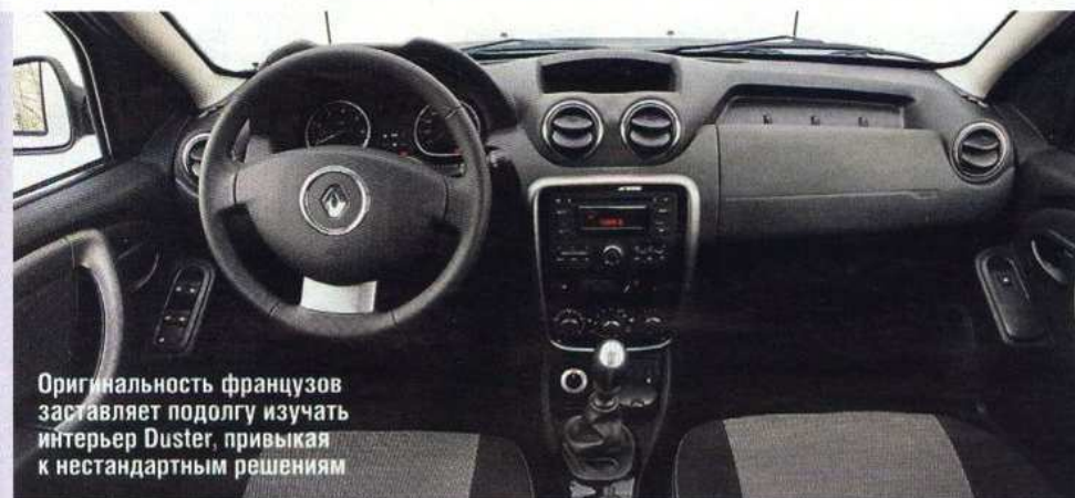
Оригинальность французов заставляет подолгу изучать интерьер Duster, привыкая к нестандартным решениям

ста). Откуда взялись лишние сантиметры у «китайца», становится ясно при взгляде на багажник — здесь он явно меньше, чем