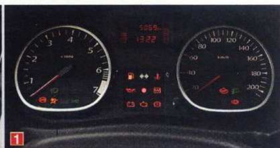
1. Хотя здесь у «француза» все традиционно — два главных прибора дополнены цифровым табло