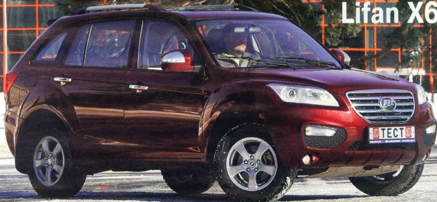
Фото: В. АРТЕВ, схема: С. СТЕПАНОВ