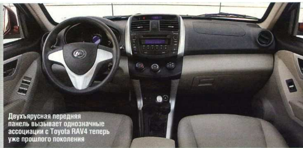
Двухъярусная передняя панель вызывает однозначные ассоциации с Toyota RAV4 теперь уже прошлого поколения