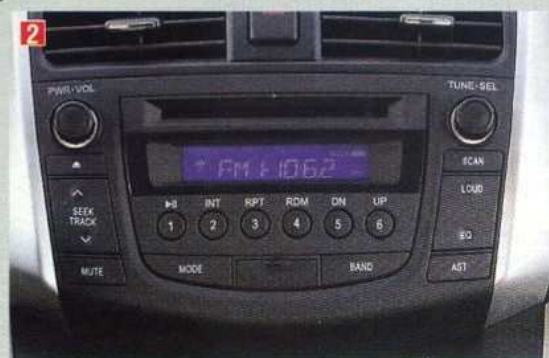
2. Красота — великая сила. И простота тоже. Головным устройством X60 можно пользоваться и без инструкции