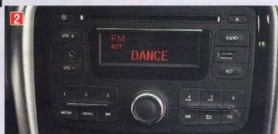
2. Странно, что единственная «крутилка» отвечает за настройку частоты, а не за громкость