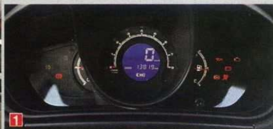
1. Щиток стоит признать неудачным: оцифровка шкалы тахометра слишком мелкая, а эффектный цифровой спидометр сильно «под тормаживает» в показаниях

ет — довольствуйтесь малым! Единственным недостатком, постоянно обсуждаемым на интернет-форумах владельцев Duster, можно считать отсутствие комбинации полного привода и автомата.