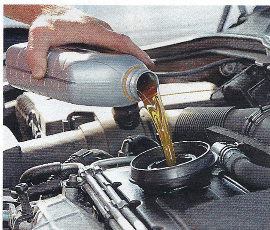
Масло, которое залили в мотор, может быть самым что ни на есть качественным, но из-за присадок в топливе оно становится слишком вязким